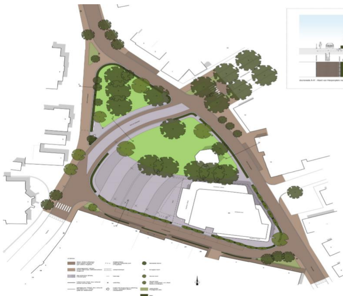
Ontwerp van het nieuwe dorpsplein in Herpen

Als alles dan volgens plan verloopt hebben we voor het einde van het jaar een prachtig nieuw dorpshart! Hierbij een schets van hoe het eruit komt te zien en als je meer wilt weten, kun je kijken op de site van de gemeente www.oss.nl en zoeken op ‘Alard van Herpenplein’.