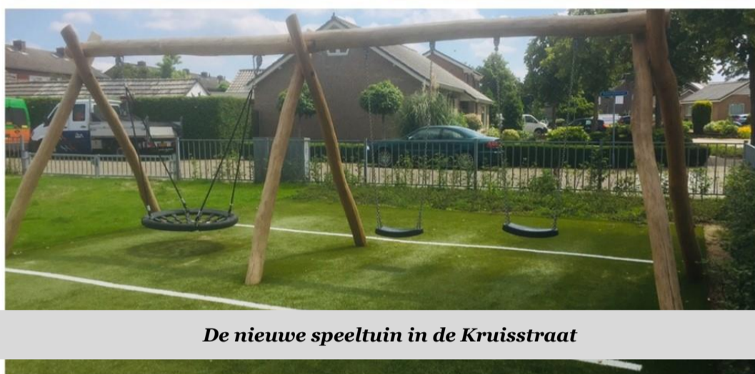
De nieuwe speeltuin in de Kruisstraat